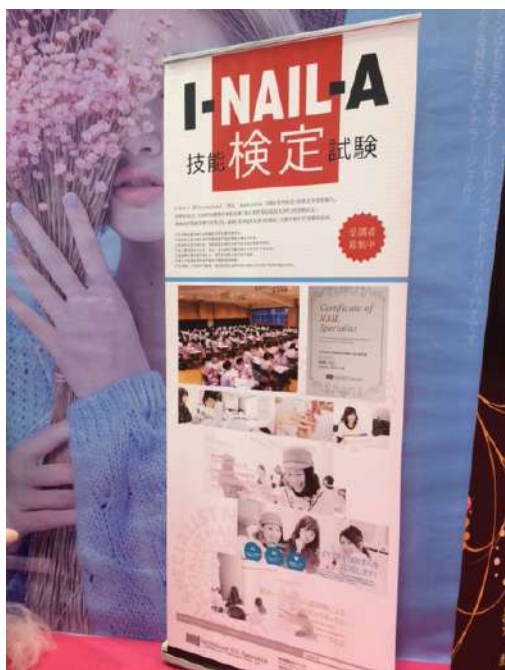
中国 広州 交易会にて